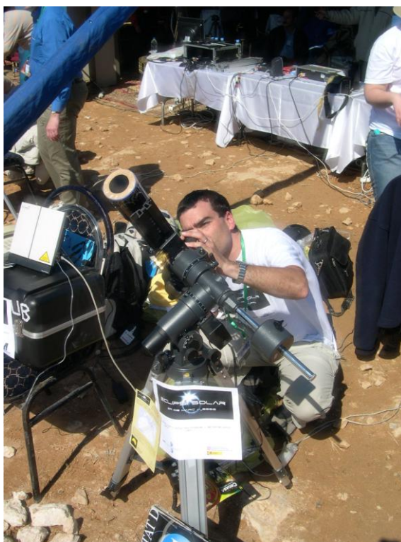
L'autor amb el refractor de 66 mm sobre muntura equatorial motoritzada que es va fer servir per la retransmissió en directe de l'eclipsi.

Una vegada muntat i provat tot el material, va donar temps de relaxar-se una mica abans del començament de l'eclipsi. Era el moment de gaudir de l'ambient i l'expectació que s'estava generant en el camp d'observació. La nostra proximitat al centre de premsa i el nostre aparatós instrumental observacional ens va fer un dels objectius predilectes dels periodistes que es passejaven pel camp, de manera que vàrem ser entrevistats per diverses televisions i ràdios egípcies, així com per la corresponent de l'agència EFE en aquell país. Tot això va acabar poc abans de les 9h20m TU, moment del primer contacte. Era el moment de posar-se a la feina i començar a prendre imatges de la parcialitat cada 5 minuts. Les imatges eren automàticament tractades (es baixava la resolució i se sobreimpressionava la data i l'hora, així com el logotip de la UB) i enviades via FTP al servidor de la UB a Barcelona.