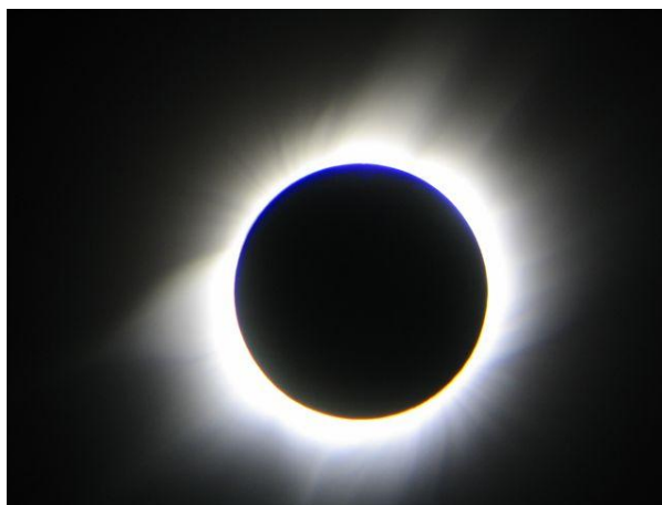
Jaume Roca: corona a Side (Turquia)