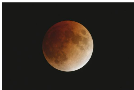
Eclipsi de lluna 210208. A. Capell

Fe de errades: El passat butlletí vàrem ometre el número, que era el 12. A més les fotos del final estaven en el bon ordre però els autors no : la foto atribuïda a Pere Closes era de A. Capell i viceversa.